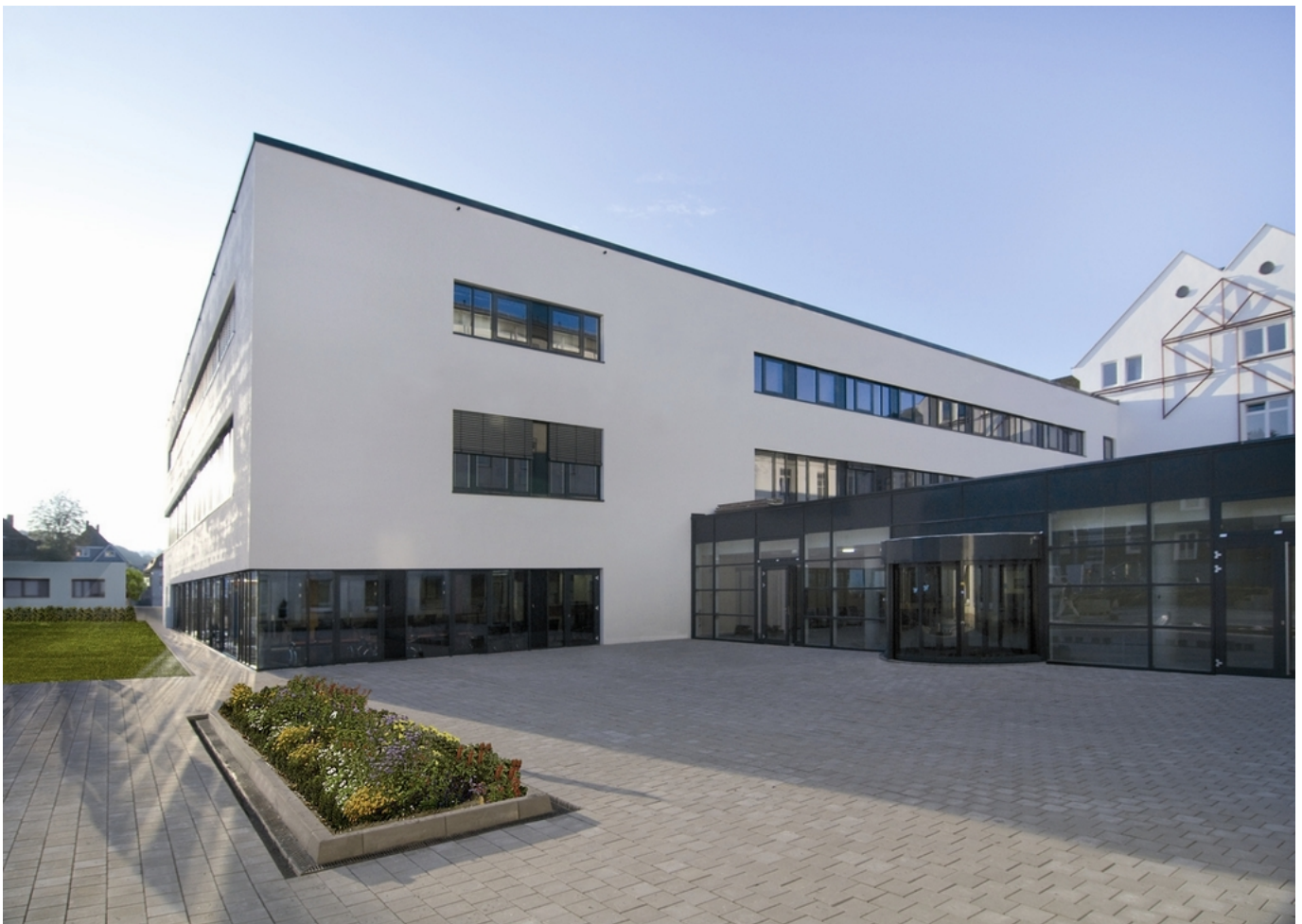
Abbildung: Kreisklinikum Siegen Haupteingang und zentrale Patientenaufnahme